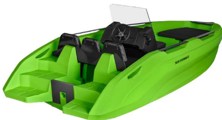
17 HDPE ADVANTAGE