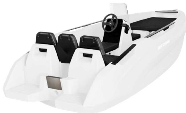
14 HDPE ADVANTAGE