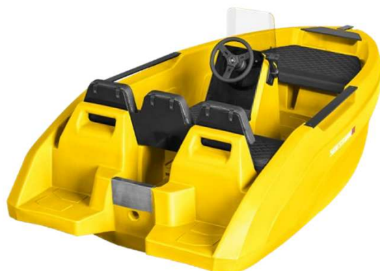
12 HDPE ADVANTAGE