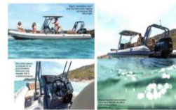
Des coups sur l'eau, les Profond Voiles de Saint-Tropez se sont également au mouillage.