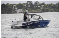
Suzuki Hors Bord : Une édition limitée