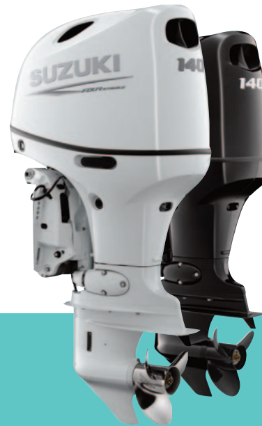
DF140BTG 4 cylindres - 4 temps 2045 cm 3 16 soupapes 103 KW - 140 ch Injection électronique

*Jusqu'à 5242 € d'économie VOIR CONDITIONS AU DOS