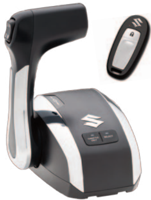
Commande Électronique SPC Démarrage Sans Clé