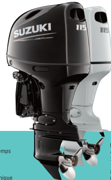
DF115BTG 4 cylindres - 4 temps 2045 cm 3 16 soupapes 84,6 KW - 115 ch Injection électronique

S'offrir un des nouveaux 115 ou 140ch «Revival», c'est la certitude de naviguer en première classe. Le confort de navigation et la douceur des commandes représentent ce qu'il se fait de mieux dans la catégorie. Suzuki est en effet le seul fabricant de moteurs hors-bord à proposer des commandes électroniques pour ce type de puissance.