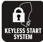
Démarrage sans clé