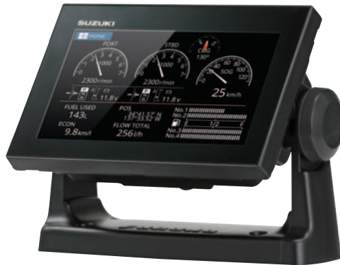
Écran tactile Multifonction 7 pouces

*Jusqu'à 5242 € d'économie VOIR CONDITIONS AU DOS